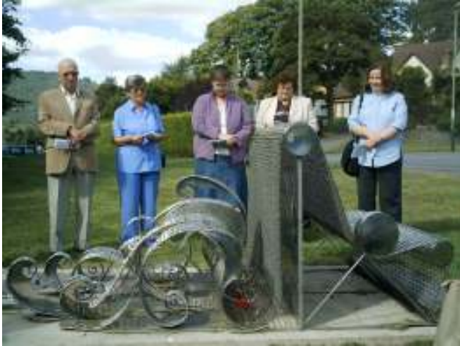
Sedd Llusi Duon Bach Wedi'i chynllunio gan David Lloyd

Mae un eitem ar y llwybr eisoes yn ei lle. Y sedd ddeongliadol yw hon, wedi'i chynllunio a'i gwneud gan Gideon Petersen . Mae'n cyfeirio at y stori drist a ddigwyddodd 15 Gorffennaf 1875 pan ddifrodwyd y ffatri wlân leol gan lifogydd a lladdwyd 12 o bobl. Dadorchuddiwyd y sedd yn ffurfiol mewn seremoni 15 Medi a fu hefyd yn coffáu'r rheiny a fu farw.