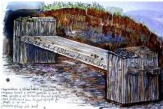
Tan y Ddaear Uwch y Ddaear Wedi'i chynllunio gan Lynne Denman